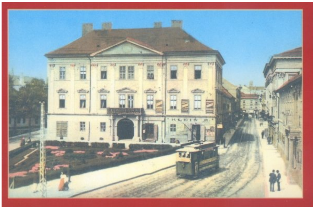
Tramvaiul electric in fata Casei Mocsonyi, ce avea intrarea din Piata Balas de atunci. In prezent, in stanga este Shopping Center Bega, iar in dreapta, strada Proclamatia de la Timisoara