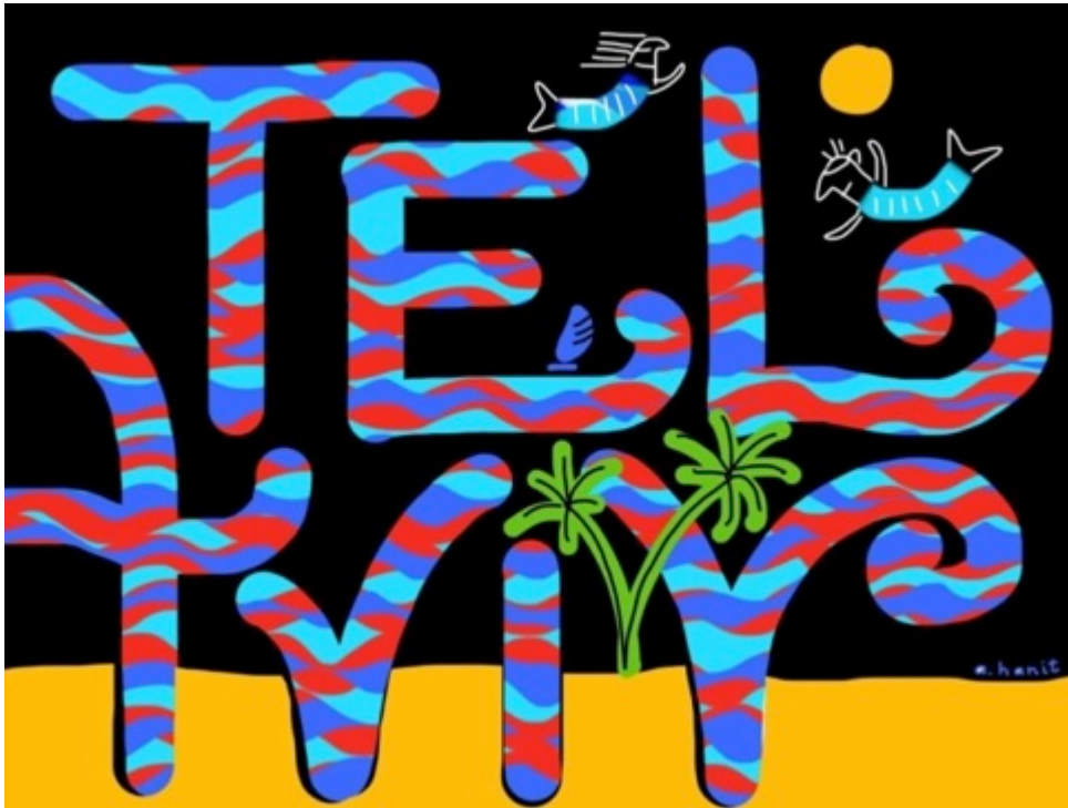
Getta Neumann, 15 iulie 2014 Ilustrații: Anath Hanit

trebuie să sperăm că perioada prezentă sumbră va fi urmată în curând de alta, mai umană, mai pașnică, în care lumina înțelegerii va răsări din nou.